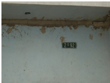
Fotografía 1. Dirección instalaciones