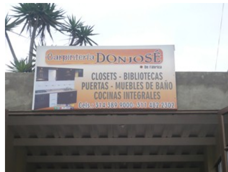
Fotografía 2. Aviso establecimiento Carpintería Don José